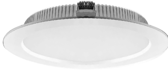
Selettore CCT CCT switch selection