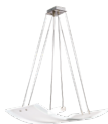
sospensione pag. 337