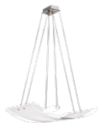
sospensione pag. 337