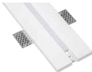
MILO01 500x90x20 mm