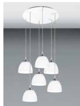
MT.ROS006FB + 6 x CLA001