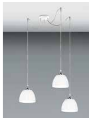
KITDEC003B + 3 x CLA001

Completare con Kit decentramento anche nella versione singola